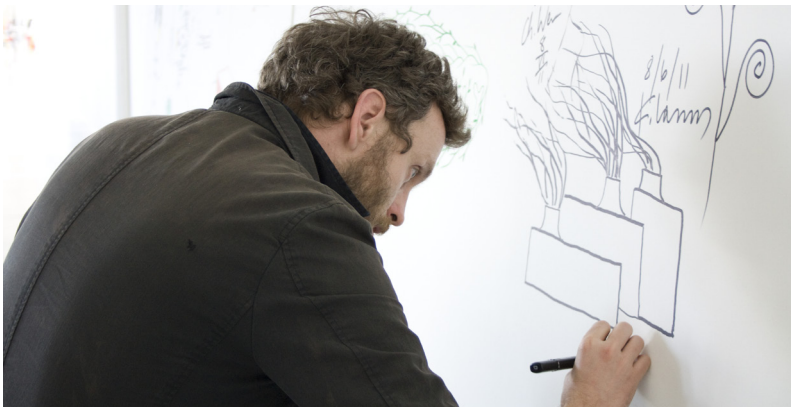
Designer bei Magis

Sorgfalt für die Details. Das Ergebnis ist eine bewusst schlichte, warme und einladende Sitzfläche mit vielseitigen Verwendung- und Einrichtungsmöglichkeiten: vom Wohnbereich, über elegante Büroräume bis hin zur Terrasse eines Cafés in der Stadtmitte. Diese transversale Vielseitigkeit wird vom Hocker, ebenfalls mit Elementen aus massiver Buche und Stahlblech, in zwei unterschiedlichen Grössen für den Wohn- und Contract-Bereich noch erweitert.