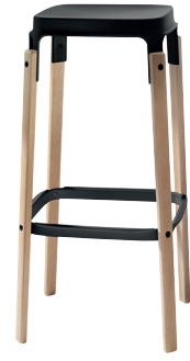
Seat + Foot-rest: Black 5140 Legs: Natural Beech