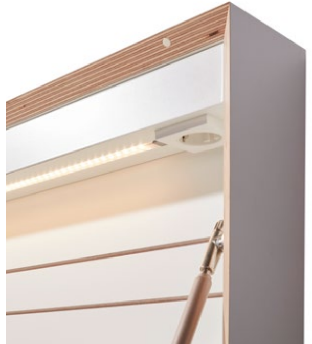
Technikpaket 2 * technology package 2