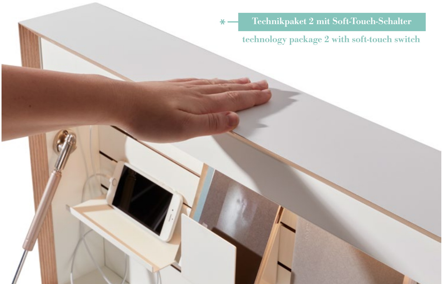
* — Technikpaket 2 mit Soft-Touch-Schalter technology package 2 with soft-touch switch