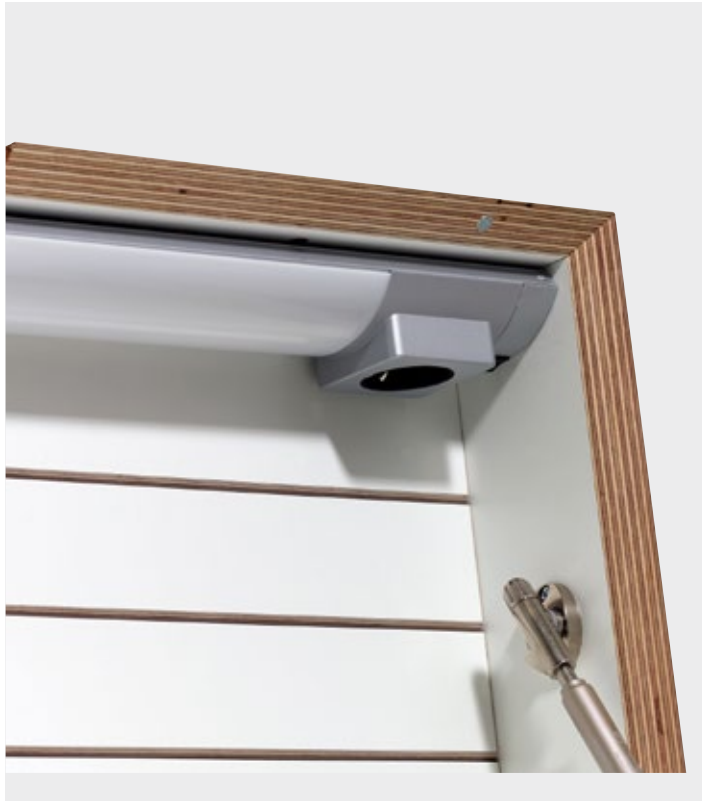
* — Technikpaket 1 technology package 1